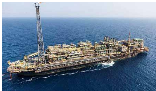
P-43, P-47, P-48