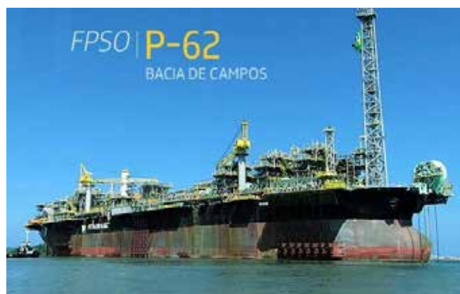
P-62, P-66, P-67