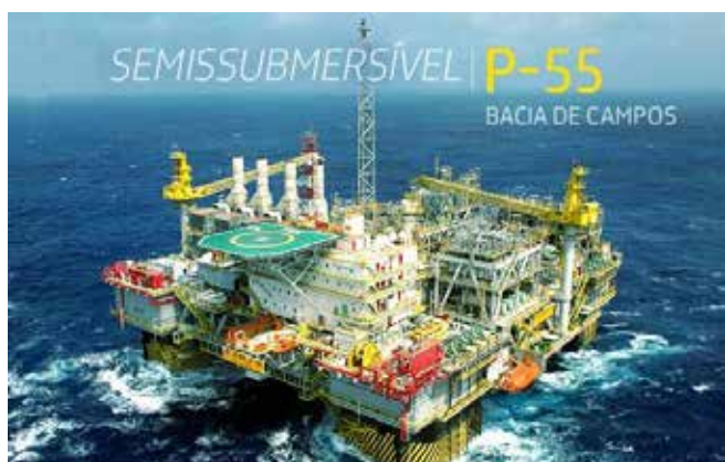
P-52, P-53, P-54, P-55