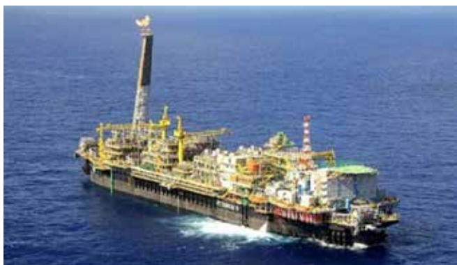
P-31, P-32, P-33, P-35, P-37, P-38